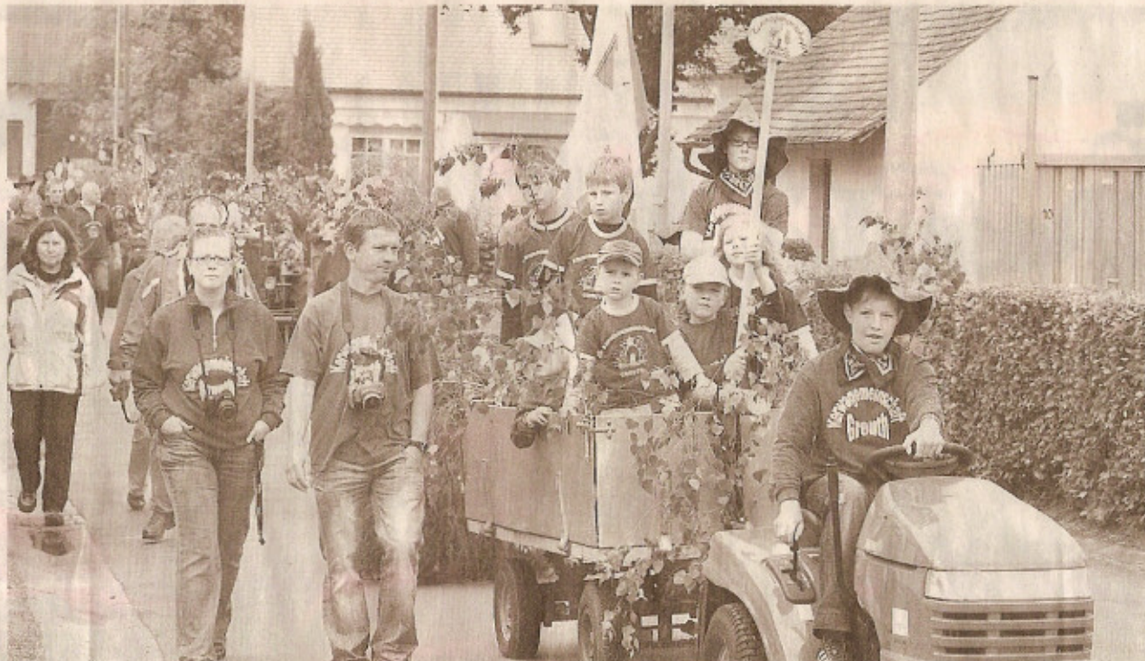
Die Kerwa hält Einzug im kleinen Höchststadter Ortsteil Greuth.